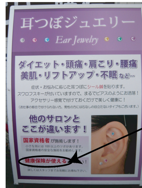
資料②: 明らかに不適切な看板の事例

保険対象外の施術行為を列挙した上で「健康保険が使える」「保険証使えます」と広告している。。。